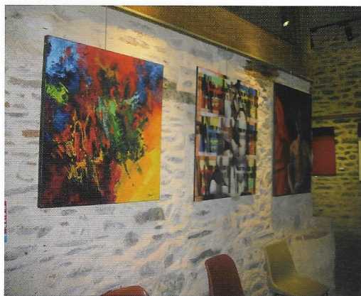
Arts PTT n° 212 - Décembre 2016

Au delà, un tableau me fait penser à des points de vue aériens. On y sent la présence de la matière terrestre, masquée par des rouleaux réguliers de nuages. Dans mon cheminement, une autre toile où, cette fois, l'usage des subtilités de la matière rendra le spectateur sensible à l'univers éthéré qui nous surplombe. Une composition attire le regard; est-ce la description spatio-temporelle qui interpelle, la juxtaposition des couleurs agencée