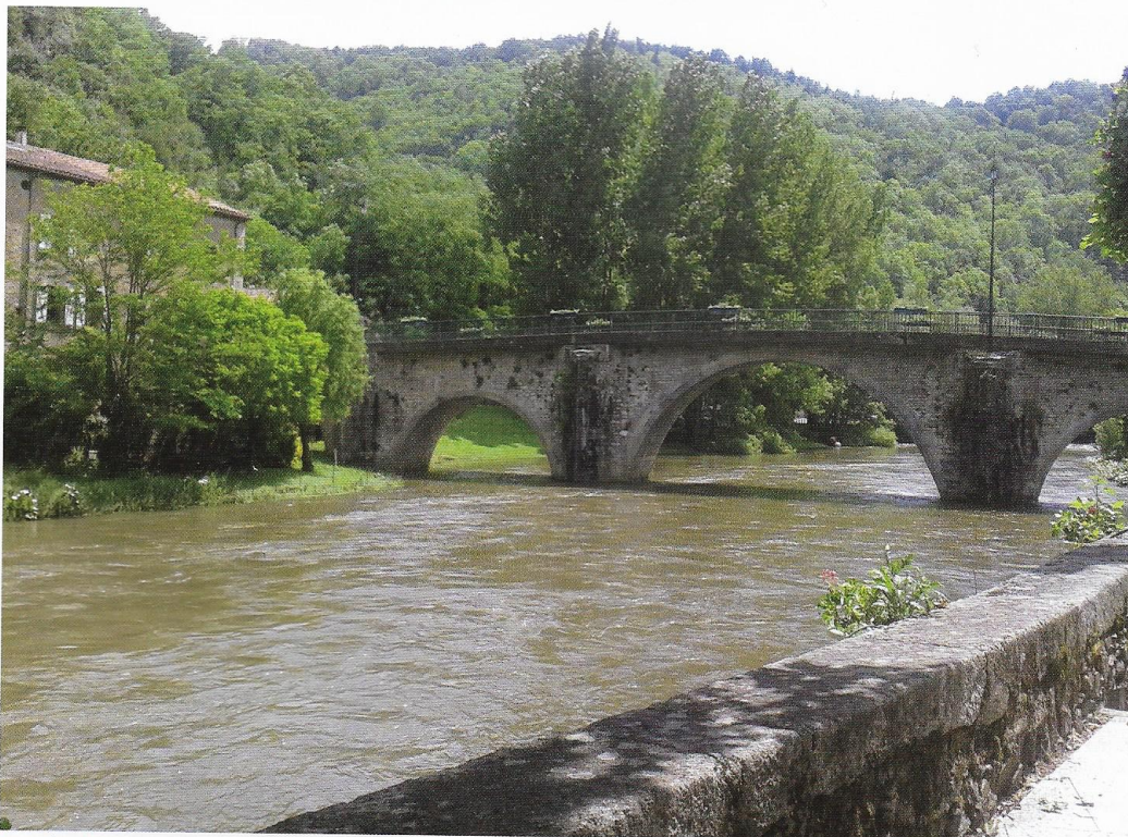
La rivière Agout

La section Toulousaine de la Société artistique a investi le pavillon Adélaïde de la cité médiévale de Burlats (81), en ce début d'automne 2016.