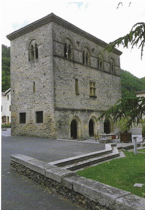
Le pavillon Adélaïde

poétique qui s'en dégage alors, a le goût ici, d'un impressionnisme revisité. Plus loin, plus tard, ce sera une élégance toute orientale, je pense à Delacroix, que suggère une partition affleurant ou le suc évaporé d'une fleur asiatique.