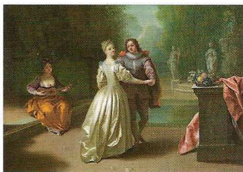
Couple dansant dans un parc (1725) Château de Weissenstein Pommersfelden

sitions avec un naturel et une aisance remarquables. Cette approche du genre noble va séduire son public par sa modernité d'alors, une clientèle avide de nouveautés. L'illusionnisme et la virtuosité de ce peintre le rendent apte à devenir un grand portraitiste.