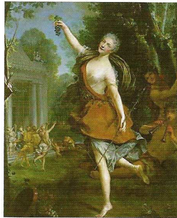
Portrait de Mademoiselle Prévost en bacchante (1723) Musée des Beaux-Arts de Tours

lèvres rosées. Sous des rondeurs avenantes, une peau satinée, et des décolletés profonds où affleure parfois un sein sous la dentelle, voir ce, Portrait de Mademoiselle Prévost en bacchante , ses "jeunes femmes"