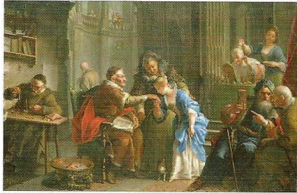
La vieillesse (1714) Collection de M. DeFrue