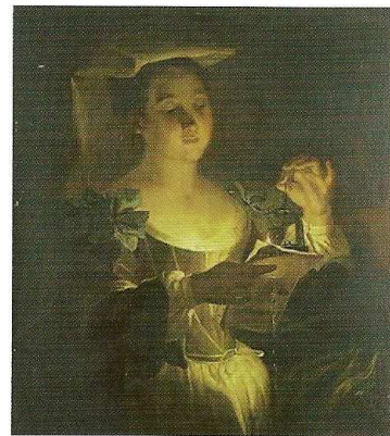
La liseuse (1719) Musée Calvet Avignon

Bien que ses portraits et scènes de genre lui assurent une clientèle suffisante, après son retour en France, Raoux pratique la peinture mythologique ou historique pendant tout le restant de sa carrière. Il va rechercher les commandes prestigieuses qu'entraîne la maîtrise parfaite des grands sujets.