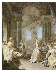
Vierges modernes (1728) Palais des Beaux-Arts Lille