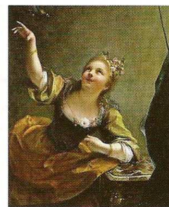
Jeune Fille faisant voler un oiseau (1717) Musée de Sarasota, Floride

l'ombre dans les manuels d'histoire de l'art. Pourtant, comme le démontre brillamment cette exposition, Raoux a largement contribué à imposer dans le goût français une autre voie que celle du "Grand Genre" (1).