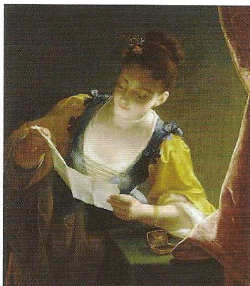
Jeune fille lisant une lettre (1726) Musée du Louvre Paris

Ses portraits, ses scènes de genre très poétiques et d'une exécution virtuose témoignent de l'esprit de ce milieu qu'il fréquente, à la fois léger, féminin et parfois mélancolique comme cette jeune fille lisant une lettre . Son trait est fin, le rendu des satins et des soieries somptueux. Les