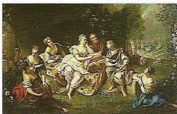
Télémaque racontant ses aventures (1722) Musée du Louvre Paris

On aurait tort de croire qu'il n'est qu'un peintre d'intérêt régional. Certes, son ami Antoine Watteau lui a fait de