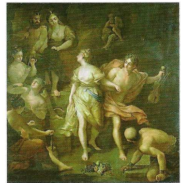
Orphée et Eurydice (1718-1720) Getty Muséum Los Angeles

De 1704 à 1714, il séjourne à Rome, Padoue et Venise où il travaille à d'importantes commandes de peintures mythologiques ( Orphée et Eurydice peinte pour le palais Giustiniani à Venise), et aussi des sujets religieux souvent demeurés