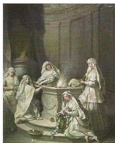
Vierges antiques (1727) Palais des Beaux-Arts Lille