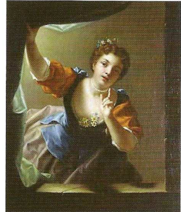
L'indiscrète (1728) Musée Calvet Avignon

peu figés, baignant dans une atmosphère quelque peu galante qui évoque son contemporain Watteau.