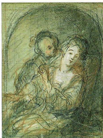
Couple d'amoureux (dessin) Palais des Beaux-Arts Lille